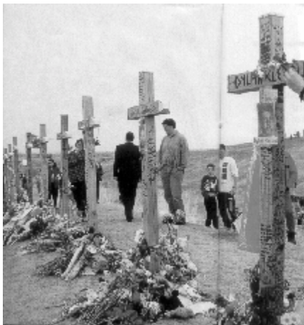
گۆپی دوو هەرزەکارە تاوانبارەکی (لتلتۆن) و قوربانییەکانیان

ئەو ریکخراوانە کارتیکیه ریکی ئایینیان لەسەرەو بە زۆری لە ناوچهکانی رۆژئاوای ناوەراستی ئەمەریکادا هەن که تیا یاندا بەها ئایینییهکان و دابونەریت و هاوکاری نیوان دراوسێکان باشتین پارێزەرن دژی کارو تەعدادی کەسانی دەرەوێ خۆیان (٥٠). ئەو ناوچهیەش (پشتینی تەورات) ی پێ دەوتریت (٥١). هەندیک لەمانە عیادە ی ئەو دکتۆرانە دەرەوێنەو کە بە کاری لەبارێدن هەلەستەن و تەنانەت دکتۆرەکانیش دەرەوێن. لە رۆژئاوادا ریکخراوی سەیرتر هەن. جۆریک لەوانە کاری توندوتیژی دژ بەو دکتۆرانە بەرپا دەکەن کە ئازەلەکان دەکەنە بابەتی توێژینەو پزیشکییەکانیان و وەکو باسیکی سەیر و سەمەرە لێردا لەبارەیانەو دەرەوێن. ئەم بزافە (مافی ئازەلان) بە وەتە چەند پزیشکیک هەپەشە لە زانستی پزیشکی دەکەن و (٥٢) شیوازی جۆراوجۆری دژایەتی پیادە دەکەن کە لە بەکارهێنانی ریکگە یاساییەو دەست پێ دەکەن تا دەکەنە ئەنجامدانی کاری توندوتیژی. ئەو ریکخراوانە بەکارهێنانی ئازەل بۆ توێژینەوێ پزیشکی بە لەناوبردنی جوولەکە دەشوبهینن (٥٣).